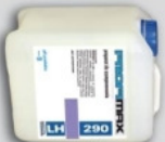
PROFIMAX LH 290 preparat do szamponowania