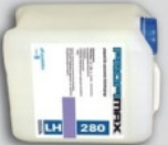
PROFIMAX LH 280 preparat do ekstrakcyjnego czyszczenia dywanów